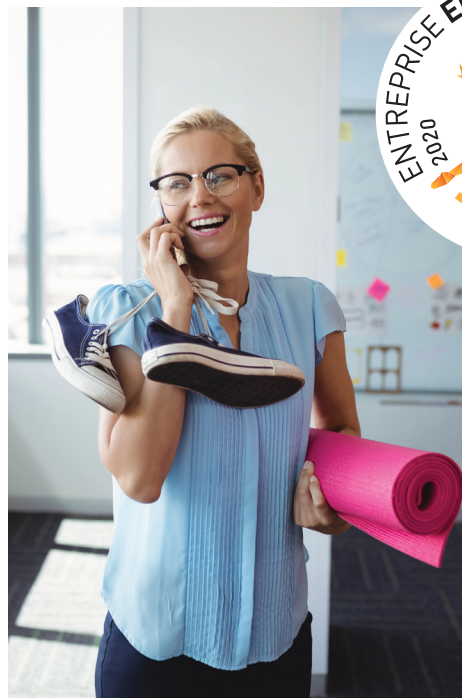
Habitudes de vie