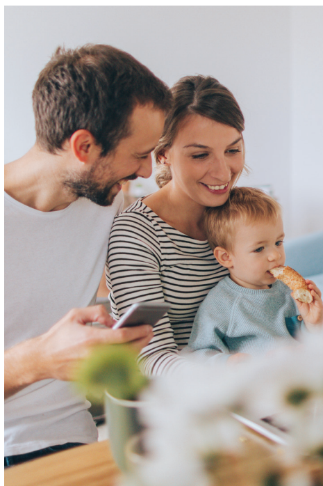
Pratiques de gestion